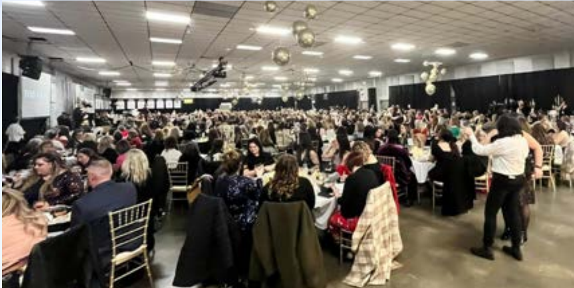
Activité Handbags for Hospice, 2023.